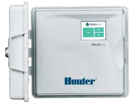
جهاز تحكم Pro-HC جهاز تحكم 6، 12 و 24 محطة