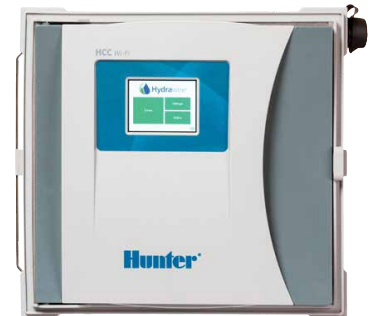
جهاز تحكم HCC جهاز تحكم 8 إلى 54 محطة