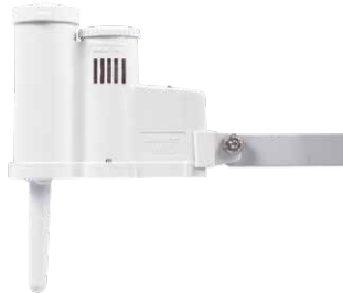
Rain-Clik تحسين معدلات استهلاك المياه مع إمكانية إيقاف عمليات الري في الموقع