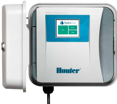
جهاز تحكم Pro-C Hydrawise جهاز تحكم 4 إلى 16 محطة

جرب البرنامج الآن من خلال النسخة التجريبية المجانية المتوفرة عبر الموقع hydrawise.com/demo