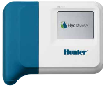
جهاز تحكم HC جهاز تحكم 6 و 12 محطة