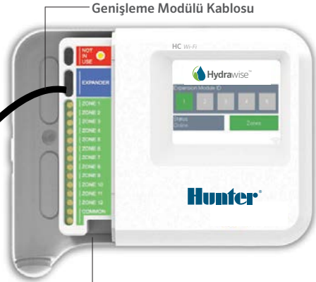
Genişleme Modülü Kablosu