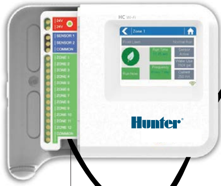
Genişleme Modülü Kablosu