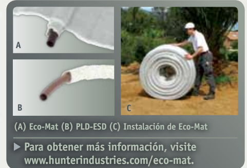
(A) Eco-Mat (B) PLD-ESD (C) Instalación de Eco-Mat

Los dos productos saldrán a la venta en agosto de 2011 y se espera que tengan un gran impacto mundial en toda clase de planes de especificación.