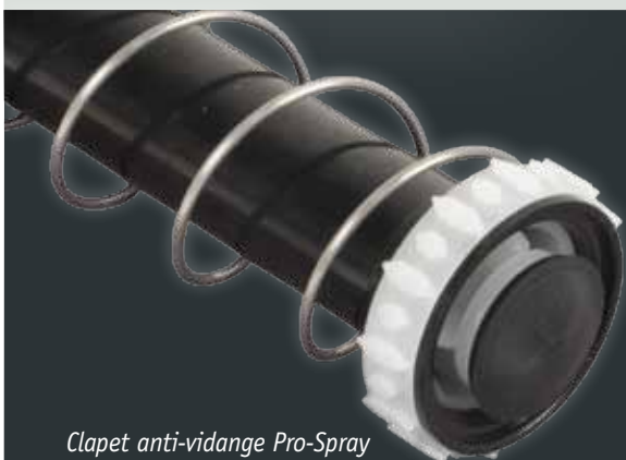
Clapet anti-vidange Pro-Spray

Les clapets anti-vidange sont un moyen simple et économique d'économiser de l'eau et d'améliorer la santé des espaces verts. La plupart des arroseurs et des tuyères sont dotés de clapets anti-vidange ; les tuyères en sont équipées comme options montées en usine ou installées sur site.