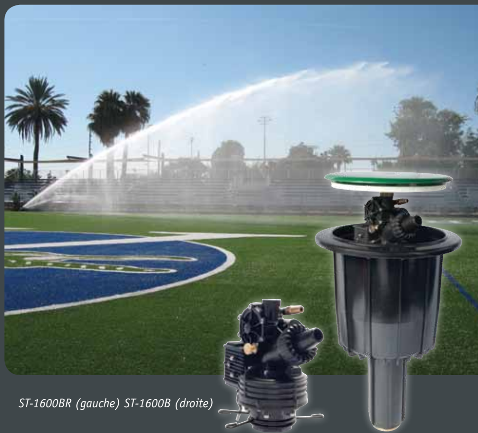
ST-1600BR (gauche) ST-1600B (droite)

Ce modèle est un arroseur monté sur piston compact et discret, de secteur réglable et de plein cercle. Le ST-1600BR est idéal pour les installations pour lesquelles il est préférable que l'ensemble des canalisations et des équipements d'irrigation soient en dehors de la surface synthétique. La configuration sur piston permet également que les terrains de sport synthétiques existants soient compatibles pour l'irrigation sans intervenir sur la surface de jeu. Ce modèle est également idéal pour les hippodromes, les carrières équestres et les espaces nécessitant de minimiser la poussière en remplaçant les arroseurs de type à impact vertical par cet arroseur silencieux et performant.