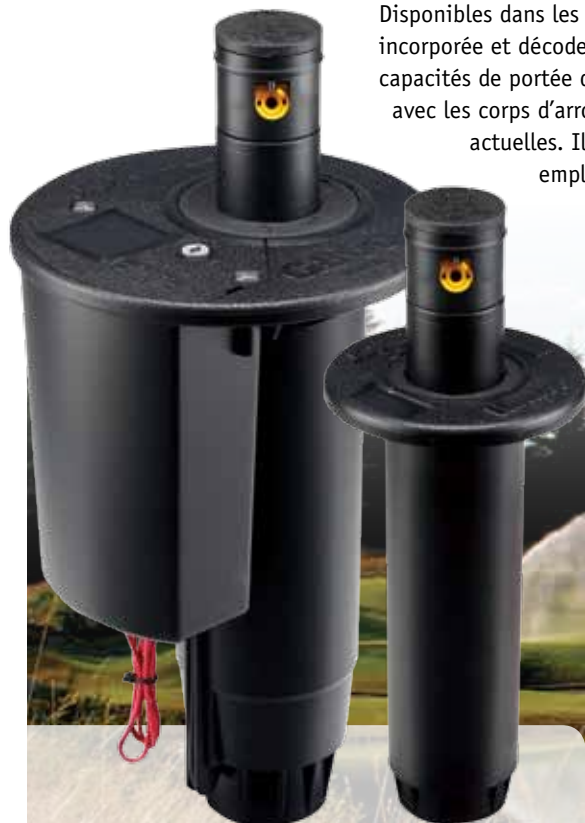
G835 (gauche) G35B (droite)

Vous bénéficiez ainsi d'un arroseur pouvant être réglé sur n'importe quel secteur en quelques secondes. De plus, vous pouvez effectuer des réglages à n'importe quelle phase d'entretien, avec le flow stop installé sans débit d'eau lorsque l'arroseur fonctionne. À noter également que la fonction Quick-Set 360 est désormais disponible sur tous les arroseurs des séries G75B et G875.