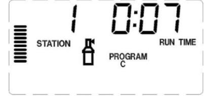
1. istasyon Döngüsü Çalışıyor