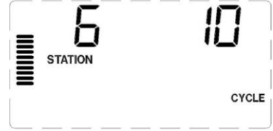
Sadece dakikalara gözükken örnek Döngü Ekranı

1 saatten önce sadece dakikalar (örneğin 36) gösterilir. 1 saat veya sonrasında gösterge saat hanesi eklenecek şekilde (örneğin 1:13 ve 4:00) değişir.