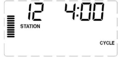
Saat hanesinin eklendiği örnek Döngü Ekranı