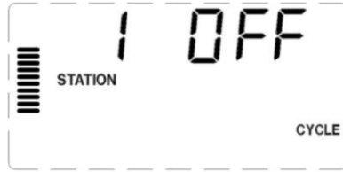
Girişte gösterilen Döngü Ekranından bir örnek

Varsayılan olarak 1. istasyon gösterilir. Diğer istasyonlara ulaşmak için ► ve ◀ tuşlarına basın.