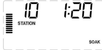
Saat hanesinin eklendiği örnek İslatma Ekranı

ve ıslatma zamanı olarak 10 dakika belirlemektedir.