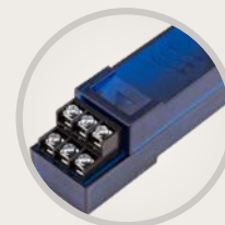
A2C-F3 Модуль расширения для подключения 3-х датчиков расхода

Трубка 2" / 50 мм Требуемый расход: 190 л/мин Скорость потока : 1,5 м/сек