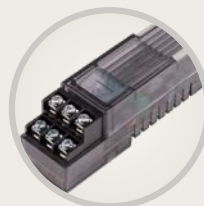
A2M-600 Стандартный модуль для подключения 6 станций с улучшенной защитой от перенапряжения