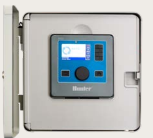
Металл. корпус для настенного крепления (серое порошк. покрытие или нерж. сталь) Высота: 15.7" (40 cm) Ширина: 15.7" (40 cm) Глубина: 6.8" (18 cm)