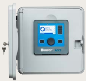
Пластиковое настенное крепление Высота: 16.8" (43 cm) Ширина: 16.8" (43 cm) Глубина: 7" (18 cm)