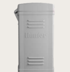
Пластиковая стойка Высота: 39.5" (100 cm) Ширина: 23.5" (60 cm) Глубина: 17" (43 cm)