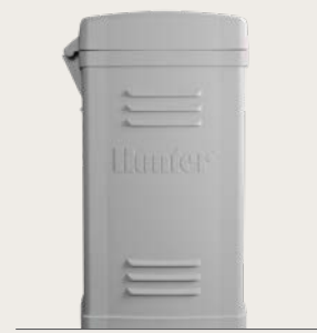
Пластиковая стойка Высота: 39.5" (100 cm) Ширина: 23.5" (60 cm) Глубина: 17" (43 cm)