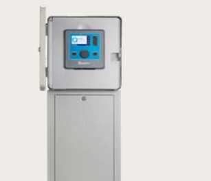
Металлическая стойка (серое порошк. покрытие или нерж. сталь) Высота 37" (94 cm) Ширина: 15.5" (39 cm) Глубина: 5" (13 cm)