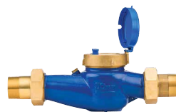
Medidor de caudal HC