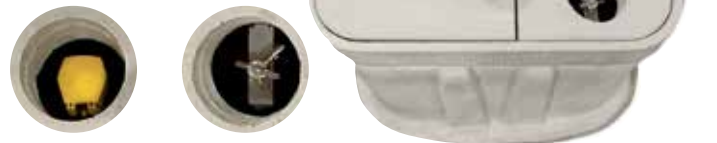
① Can Suyu Vanası ② Açık-Kapalı-Otomatik Seçici

Ana kapak: 61 cm x 91 cm Toplam yükseklik: 91 cm Gövde ağırlığı: 70 kg Toplam ağırlık: 138 kg Taban pedi: 106 cm x 122 cm Hızlı erişim portları: 2