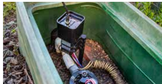
Универсальный комплект для монтажа декодера на стойке